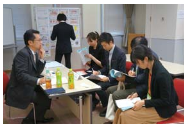
活発なディスカッション 研究のプレイスルーが得られることも SCCJセミナーの魅力

化粧品業界のみならず、食品、化学品、工業品を扱う異業種の技術見学会なども開催しています。きっと日常業務では得られない体験と発見を得られることでしょう。