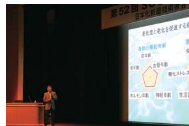
酸化と糖化による 老化のメカニズムについて学びました