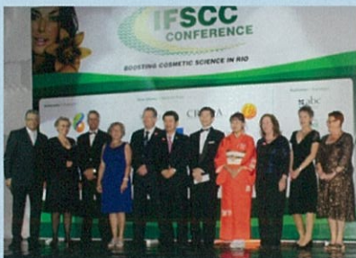
IFSCC2013ブラジル中間大会の様相