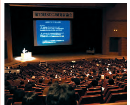
SCCJ 研究討論会の模様

化粧品技術者・研究者が最も注目している化粧品技術に関する研究発表の場で、会員をはじめ化粧品関連分野から数多くの最新の研究成果が発表されます。毎回、オリジナリティーのある研究成果が発表され、参加者によって終始活発な討論が行われております。