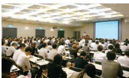
大阪支部 第1回化粧品実践講習会の模様