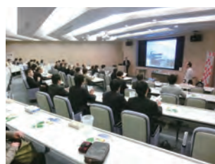
東京支部 技術見学会の様様

(※1) 準会員は35歳未満(4月1日時点)の方が対象です。 (※2) HPからメール配信登録していただく必要があります。