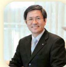
日本化粧品技術者会副会長 兼 東京支部幹事長

皆さん、この機会に積極的に参加し、今まで以上に日本の実力を世界に向けて発信しようではありませんか。