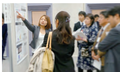
本部 IFSCC2015 国内報告会の模様

他にも講演会や勉強会、さらには若手技術者(35歳未満)が独自に開催している勉強会(コスメ倶楽部勉強会:東京、大阪で開催)が定期的で開催され、技術情報だけではなく、市場や消費者動向等の見聞を広げることができます。第一線で活躍する技術者の生の声を聞いて、皆さんの研究・開発に、ぜひお役立てください。