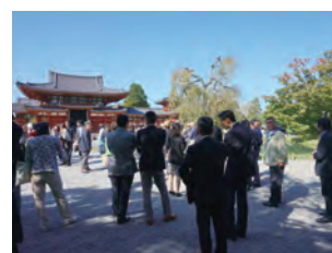
大阪支部 研修会の様様