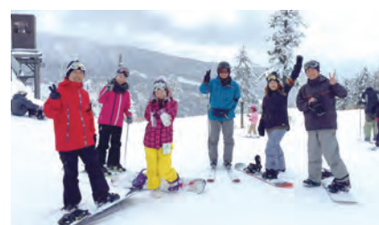
コスメ倶楽部(若手技術者主催)番外編: 交流会(スキー&スノーボード)の模様